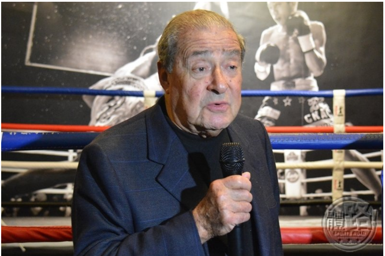
Top Rank 創辦人Bob Arum